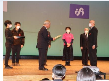
同協議会主催の「地域づくり フォーラム」で入賞広報を表彰