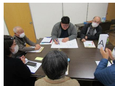
自治会長サミットVol.17 情報交換会の様子 (令和5年3月開催)