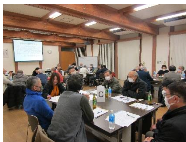
自治会長サミットVol.16 情報交換会の様子 (令和5年12月開催)